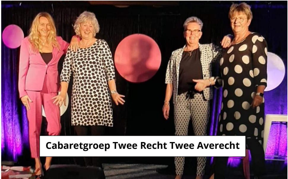
Cabaretgroep Twee Recht Twee Averecht

Voor de ledenavond hebben we deze keer vast kunnen leggen: